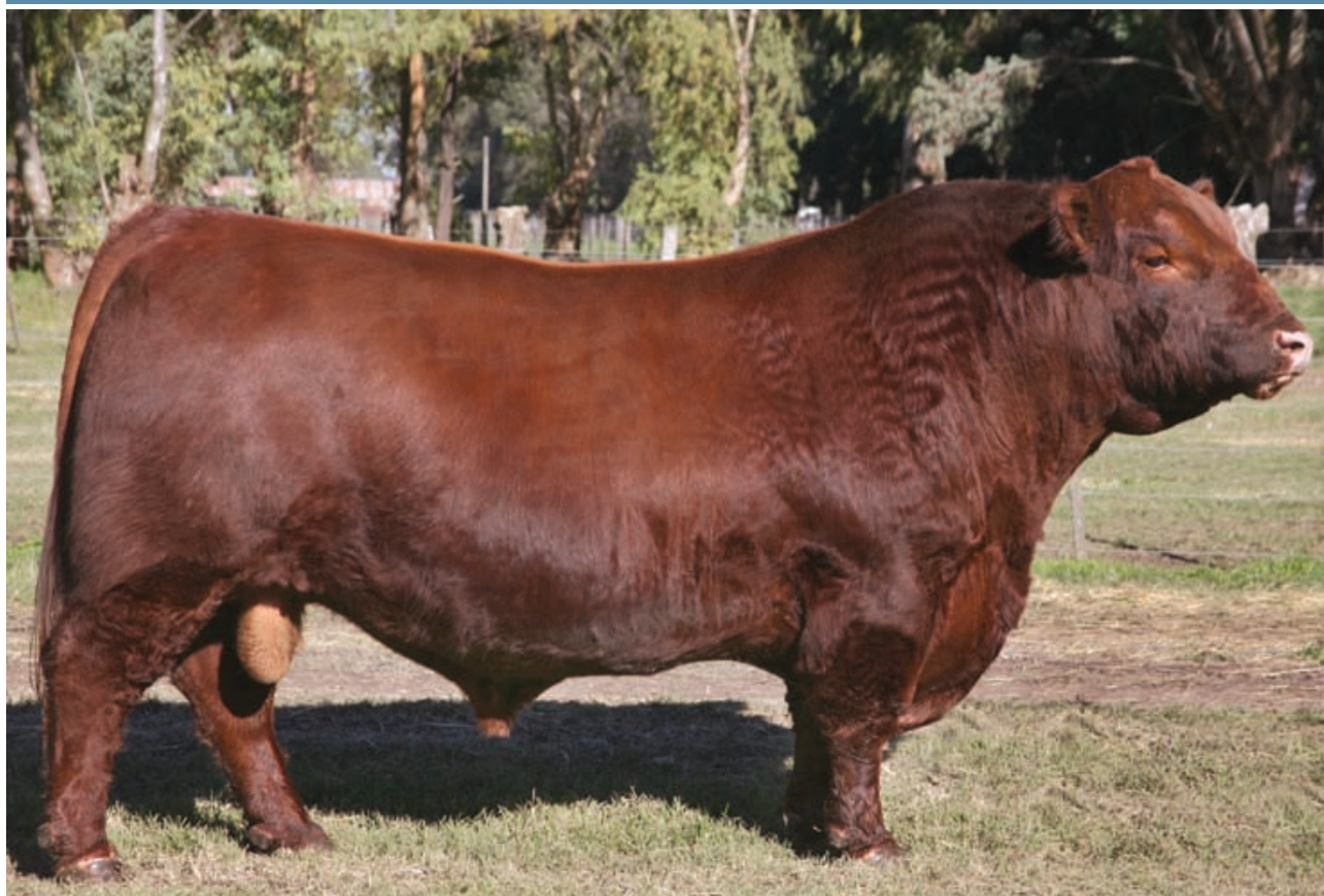
La Legua Canyon 8279 T/E

Toro carnicero, precoz con sólido color y expresión. Posee balanceados datos de performance genética, incluyendo un moderado peso al nacer, sobresaliente aptitud materna y circunferencia escrotal y un buen perfil en los caracteres de rendimiento y calidad de carne. Sus hijas se destacan por ser muy anchas, carnudas y profundas.