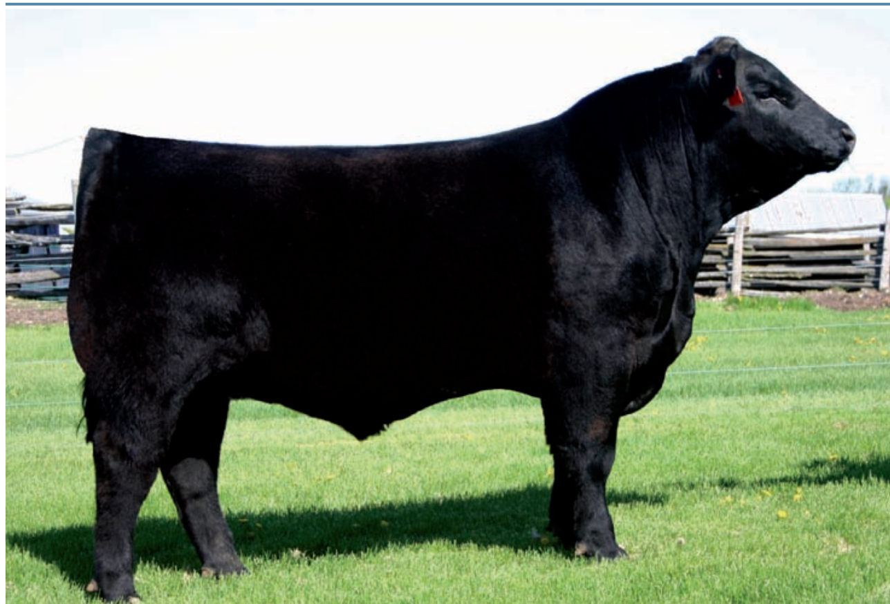
Bushs Coach 510

Un padre para tener muchos kilos a temprana edad. Moderado peso al nacer (35 kg.) pero muy alto peso al año (casi 700 kg.). Voluminoso y profundo de muy correcta estructura con patas perfectas.