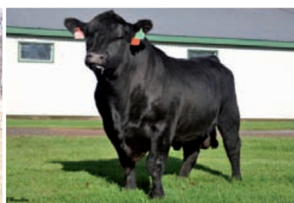
Coach Vista frontal