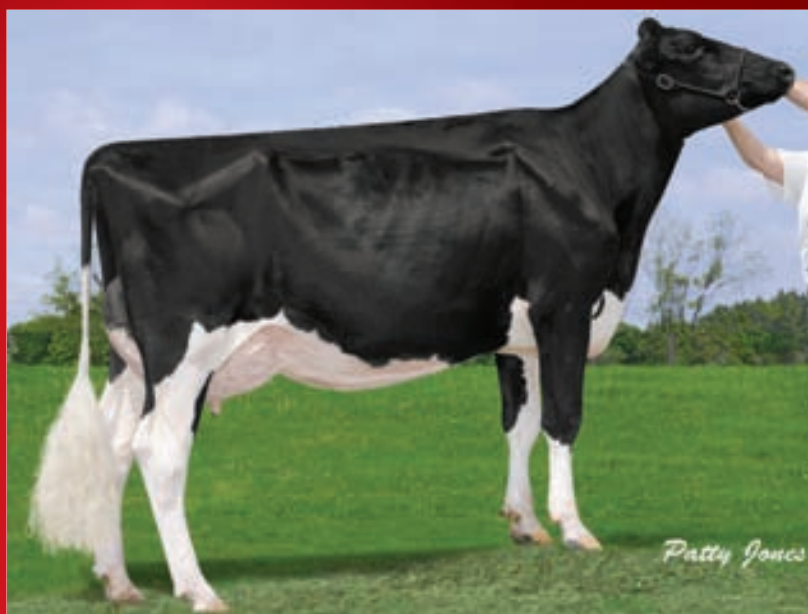
Comestar Lautamie Titanic