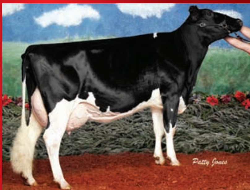
Ruissorock Titanic Sacha